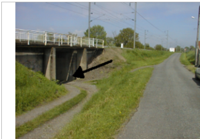
Vue du site BDHE 4004 point de repère 4006