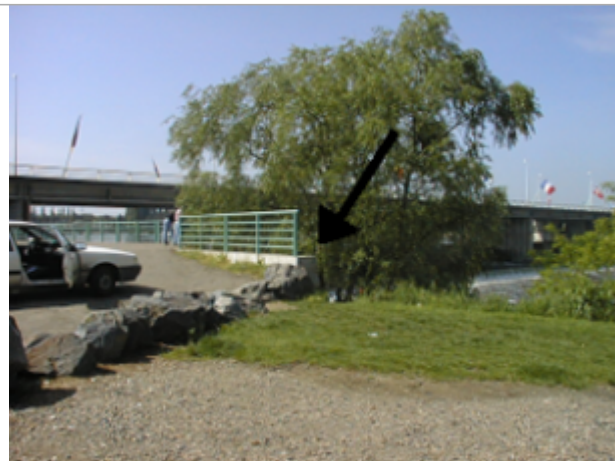
Vue du site BDHE 4002 point de repère 4000