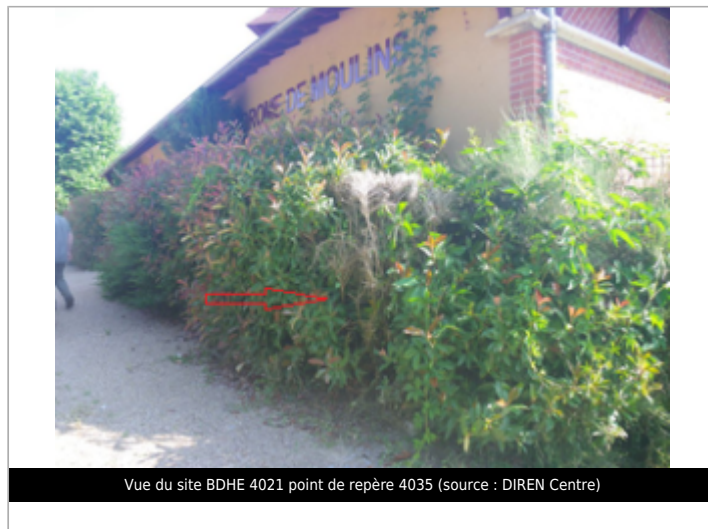
Vue du site BDHE 4021 point de repère 4035