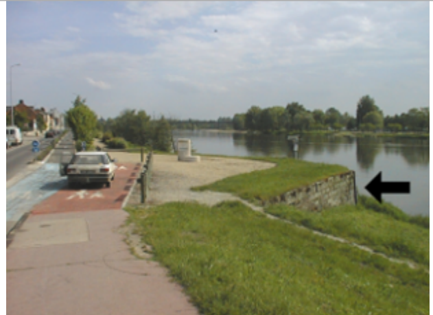
Vue du site BDHE 4019 point de repère 4032

Coordonnées WGS84 : X: 3.32575605 / Y: 46.56128903