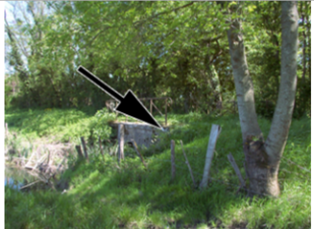
Vue du site BDHE 4155 point de repère 4089

Coordonnées WGS84 : X: 3.07163188 / Y: 46.86159389