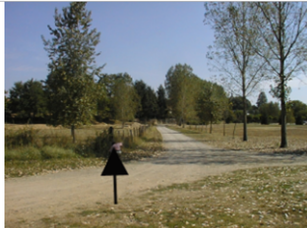
Vue du site BDHE 4062 point de repère 4062

Coordonnées WGS84 : X: 3.30254076 / Y: 46.58629505