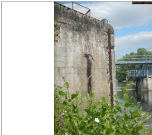
Vue de l'échelle en 2023