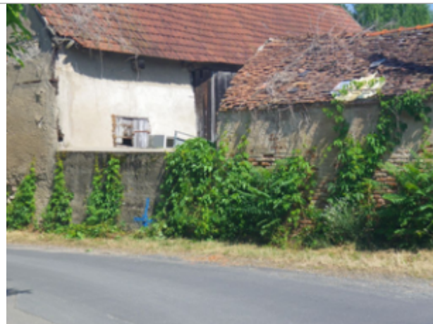
Vue du site BDHE 4022 point de repère 4036

Coordonnées WGS84 : X: 3.28892284 / Y: 46.59935058