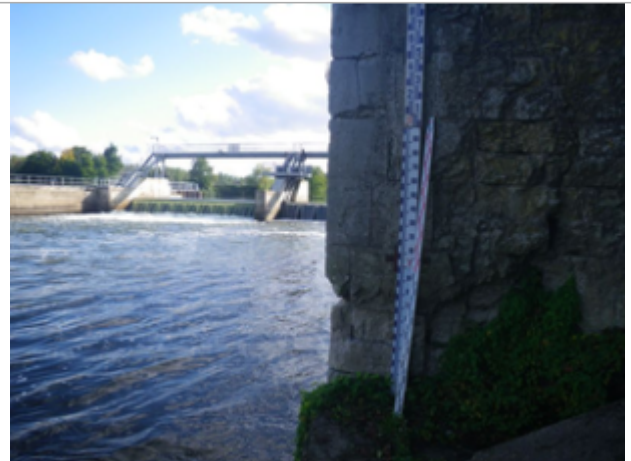
Vue du site BDHE 4065 point de repère 4097

Coordonnées WGS84 : X: 3.05060786 / Y: 46.92292918