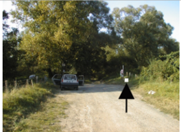
Vue du site BDHE 4044 point de repère 4052

Coordonnées WGS84 : X: 3.06755611 / Y: 46.86689056