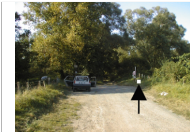
Vue du site BDHE 4044 point de repère 4052