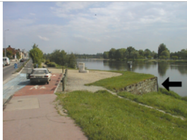
Vue du site BDHE 4019 point de repère 4032