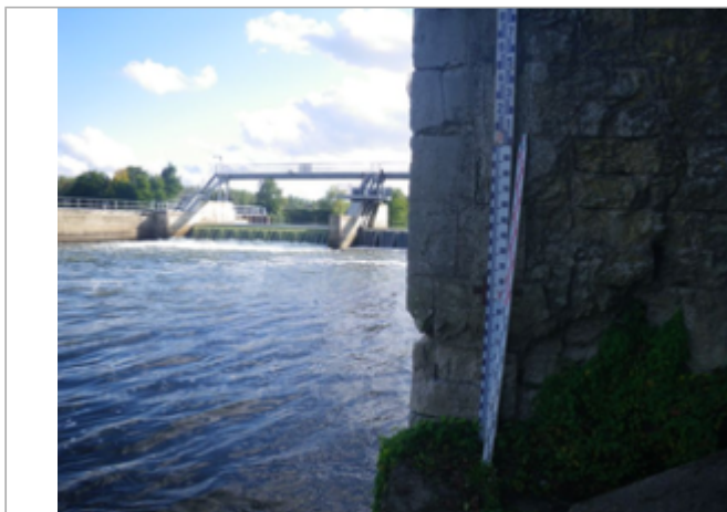
Vue du site BDHE 4065 point de repère 4097