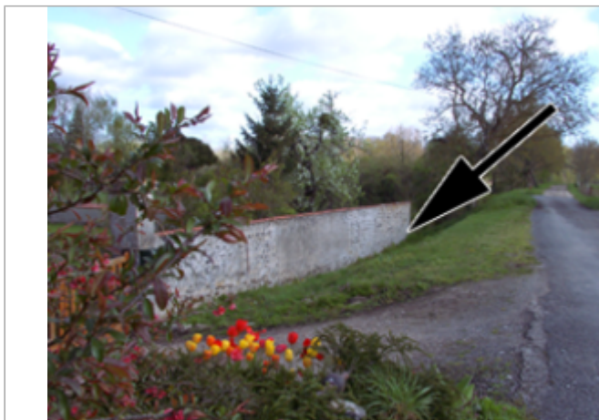
Vue du site BDHE 4041 point de repère 4085