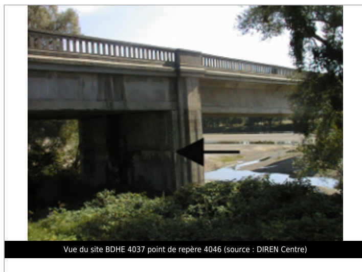
Vue du site BDHE 4037 point de repère 4046

GÉOLOCALISATION Coordonnées WGS84 : X: 3.04999611 / Y: 46.75867281 Coordonnées RGF93 (Lambert 93) X: 703816 / Y: 6628729 Coordonnées RGF93 (ETRS89) : X: 3.0499961 / Y: 46.7586728 Code Hydro: K---0080 Rive de référence: Droite