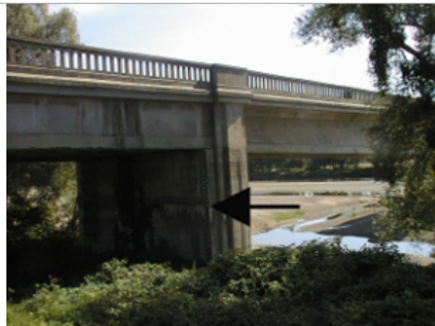
Vue du site BDHE 4037 point de repère 4046