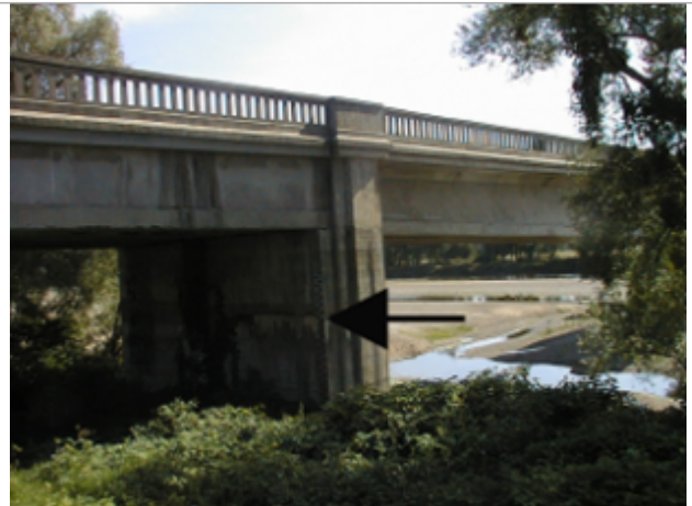
Vue du site BDHE 4037 point de repère 4046

Coordonnées WGS84 : X: 3.04999611 / Y: 46.75867281