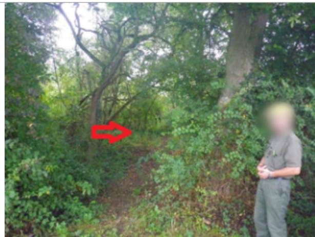
Vue du site BDHE 4032 point de repère 4041

Coordonnées WGS84 : X: 3.14255044 / Y: 46.71523163