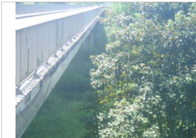
Vue du site BDHE 4027 point de repère 4040