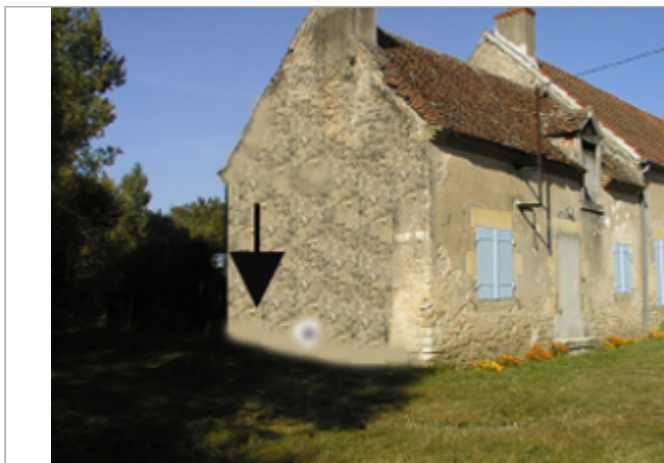
Vue du site BDHE 4042 point de repère 4051