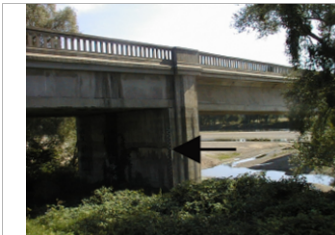
Vue du site BDHE 4037 point de repère 4046