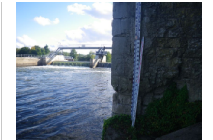
Vue du site BDHE 4065 point de repère 4097