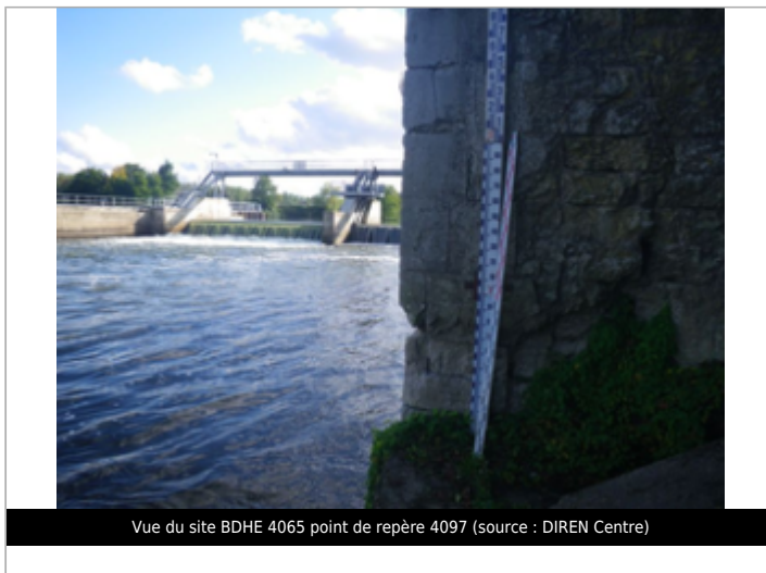
Vue du site BDHE 4065 point de repère 4097