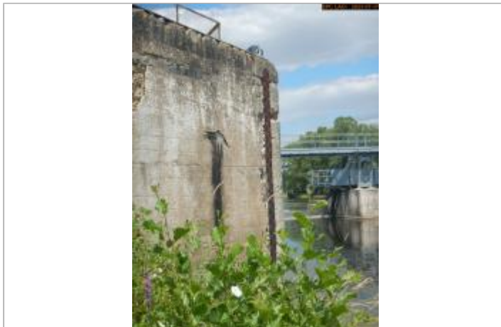
Vue de l'échelle en 2023