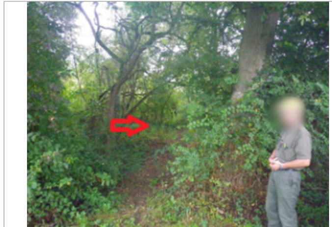
Vue du site BDHE 4032 point de repère 4041

Coordonnées WGS84 : X: 3.14255044 / Y: 46.71523163