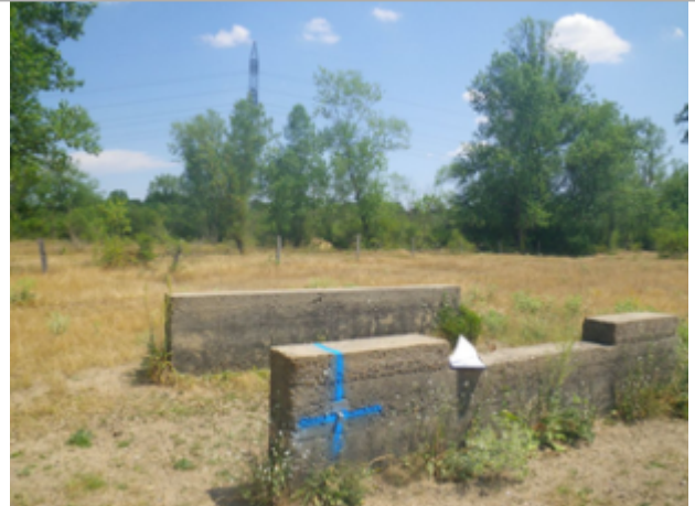
Vue du site BDHE 4028 point de repère 4070