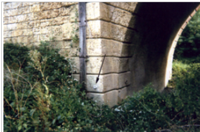
Vue du site BDHE 4051 point de repère 4057

Coordonnées WGS84 : X: 3.06205617 / Y: 46.93619488