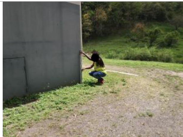
Angle bâtiment façade extérieure