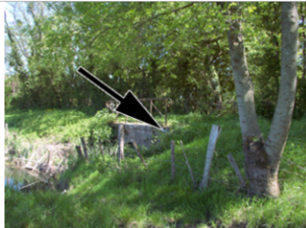
Vue du site BDHE 4155 point de repère 4089