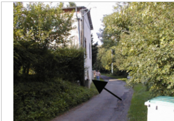
Vue du site BDHE 4121 point de repère 4215