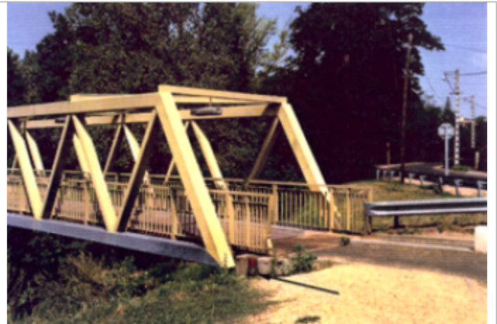
Vue du site BDHE 4111 point de repère 4196

Coordonnées WGS84 : X: 3.24893546 / Y: 45.79382029