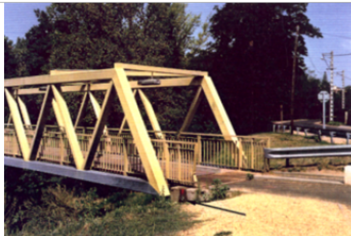
Vue du site BDHE 4111 point de repère 4196

Coordonnées WGS84 : X: 3.24893546 / Y: 45.79382029