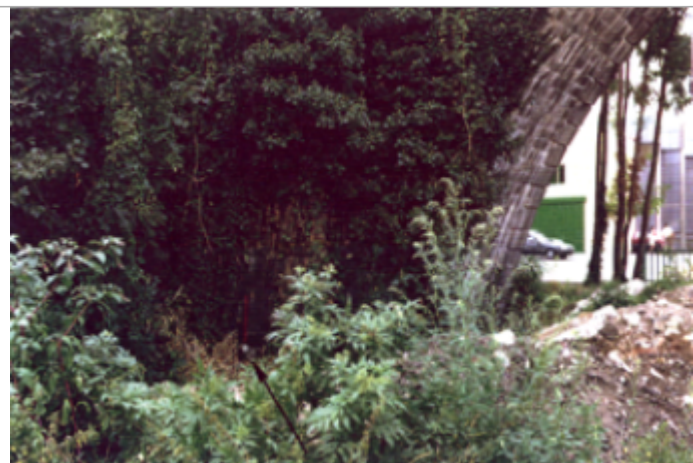
Vue du site BDHE 4110 point de repère 4195