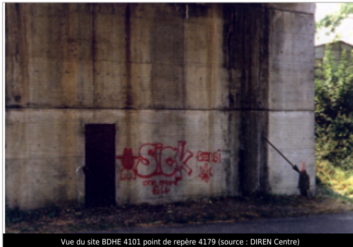
Vue du site BDHE 4101 point de repère 4179