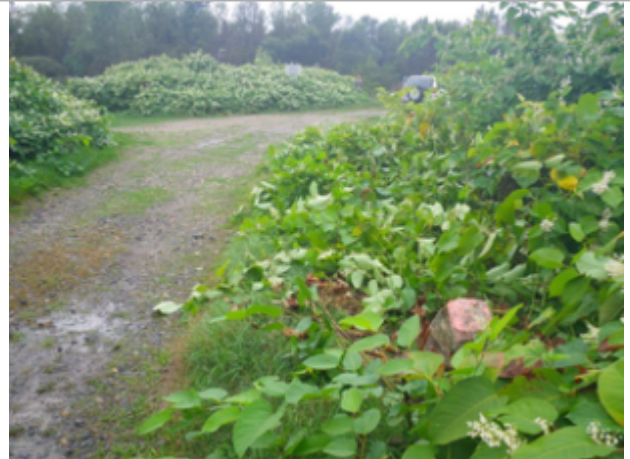
Vue du site BDHE 4006 point de repère 4010

Coordonnées WGS84 : X: 3.41976857 / Y: 46.21338988