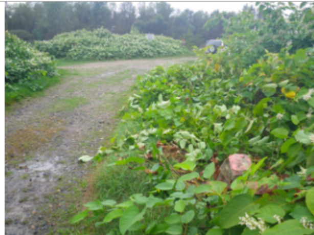
Vue du site BDHE 4006 point de repère 4010