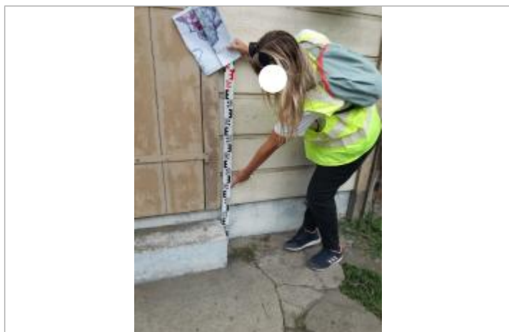
Niveau mesuré depuis le trottoir béton

Altitude calculée de l'eau (en m) : 1.05 m