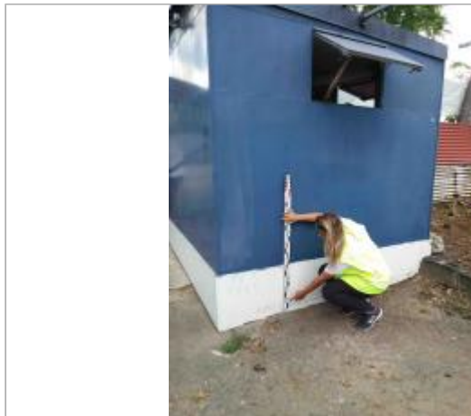
Au droit de l'entrée de l'UA

Coordonnées RGF93 (ETRS89) : X: -61.529782 / Y: 16.226896