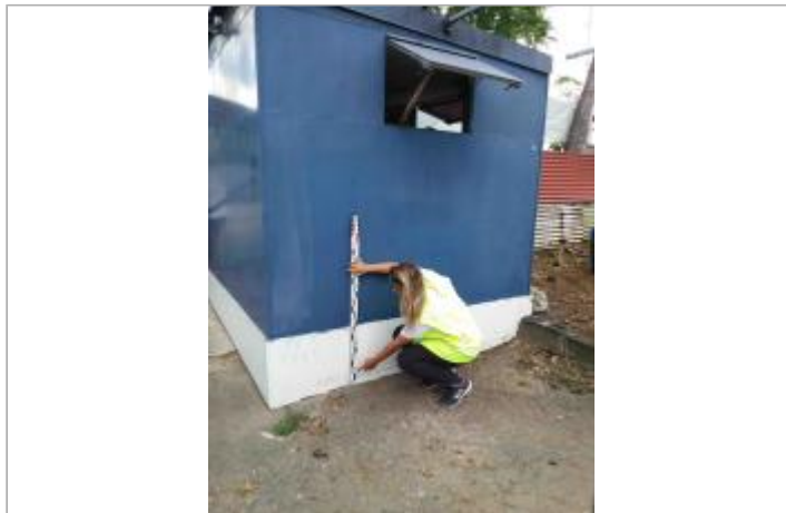
Au droit de l'entrée de l'UA

Coordonnées WGS84 : X: -61.52978200 / Y: 16.22689600