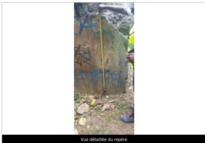
Vue détaillée du repère

Altitude calculée de l'eau (en m) : 3.309 m