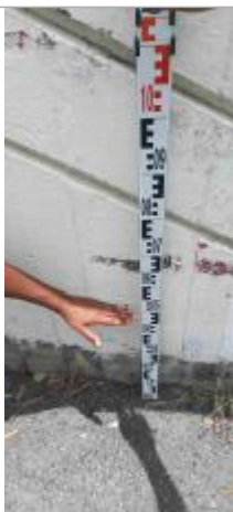
Niveau mesuré depuis le sol

Altitude calculée de l'eau (en m) : 1.73 m