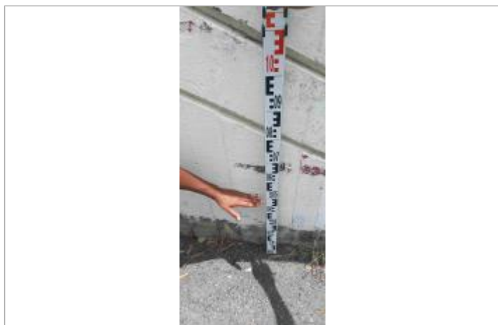
Niveau mesuré depuis le sol

Altitude calculée de l'eau (en m) : 1.73