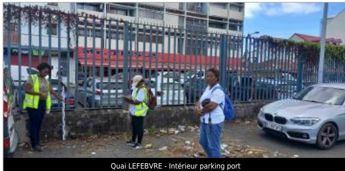
Quai LEFEBVRE - Intérieur parking port

Coordonnées WGS84 : X: -61.53822500 / Y: 16.24099500