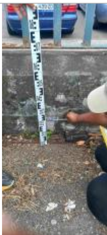
Niveau mesuré depuis le sol (coté port)

Altitude calculée de l'eau (en m) : 1.46 m