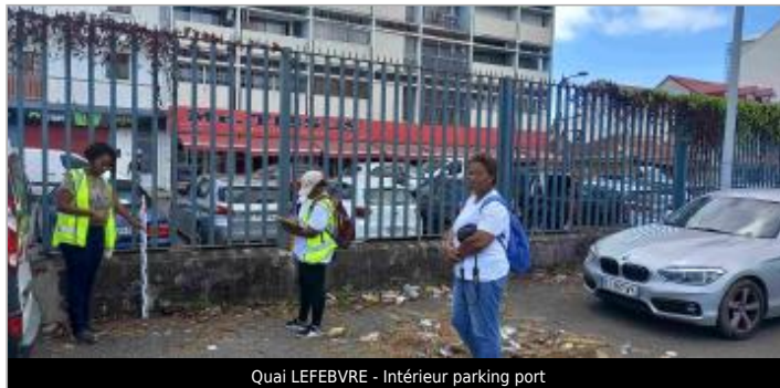
Quai LEFEBVRE - Intérieur parking port