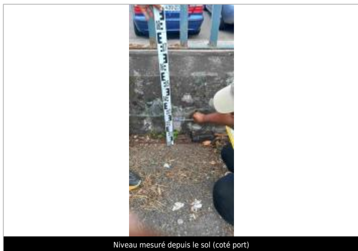
Niveau mesuré depuis le sol (coté port)

Altitude calculée de l'eau (en m) : 1.46