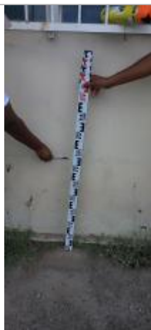
Niveau mesuré depuis le sol

Altitude calculée de l'eau (en m) : 1.07