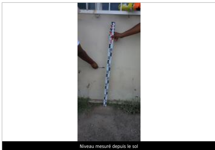
Niveau mesuré depuis le sol

SOURCE DE REPÉRAGE : CAMPAGNE DE RELEVÉS TERRAIN DEAL 971 AVRIL 2022 - 30/04/2022