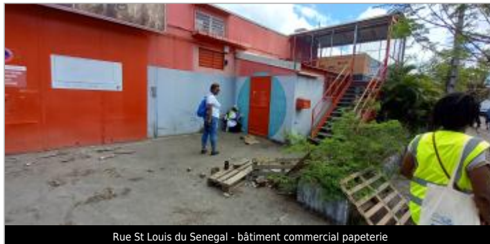
Rue St Louis du Senegal - bâtiment commercial papeterie