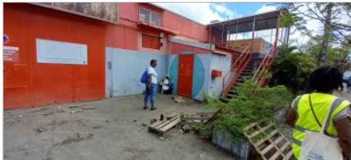
Rue St Louis du Senegal - bâtiment commercial papeterie

Coordonnées WGS84 : X: -61.54210100 / Y: 16.24616900