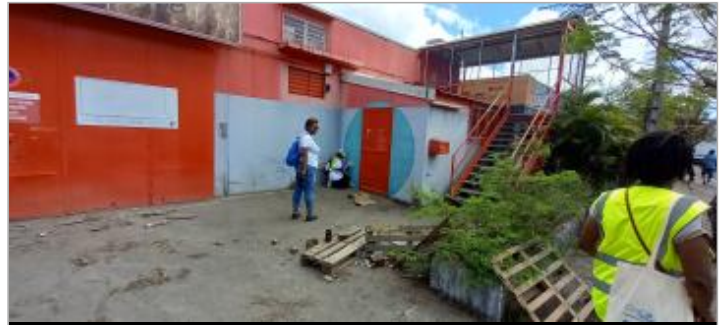
Rue St Louis du Senegal - bâtiment commercial papeterie