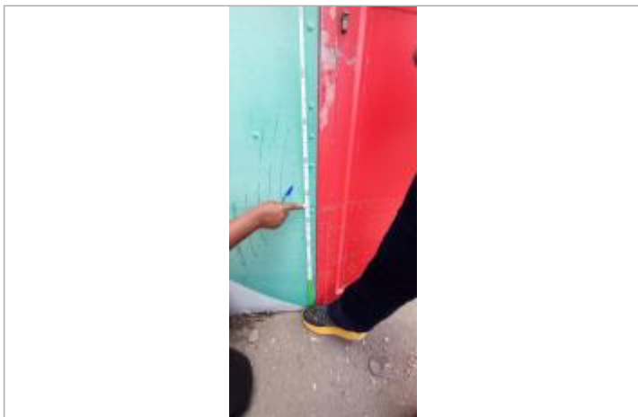
Niveau mesuré depuis le sol béton

Altitude calculée de l'eau (en m) : 1.02