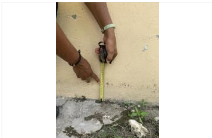
Dépôt de matières solides