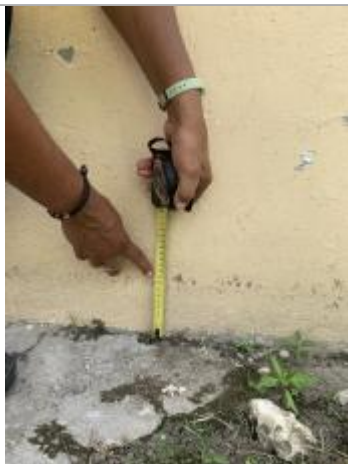
Dépôt de matières solides