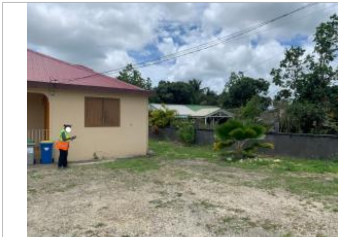
Maison chemin de Chastel

Coordonnées WGS84 : X: -61.51098000 / Y: 16.33207200