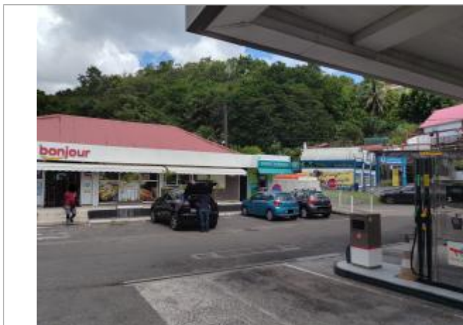
Vue depuis la RN4