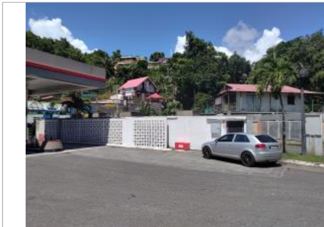
Vue depuis la RN4

Coordonnées WGS84 : X: -61.51143300 / Y: 16.21829100