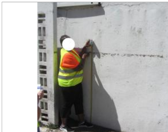
Dépôt de matières solides