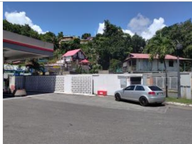
Vue depuis la RN4