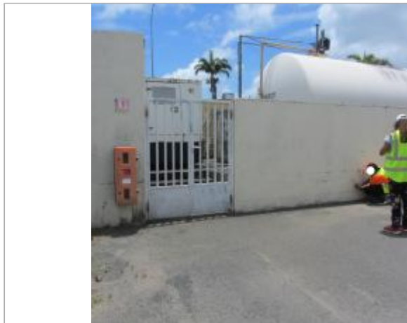
Mur de clôture

Coordonnées WGS84 : X: -61.50113100 / Y: 16.21419400