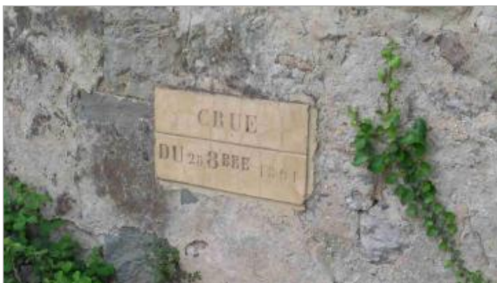
Repère sur parement aval gauche

Texte : Crue du 25 octobre 1891 Maximum de l'inondation : Oui Visibilité : Oui État du repère : Bon Pérennité : Moyenne