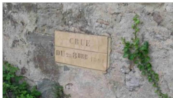
Repère sur parement aval gauche