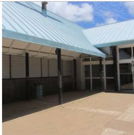
Entrée magasin consommation Bas du Fort