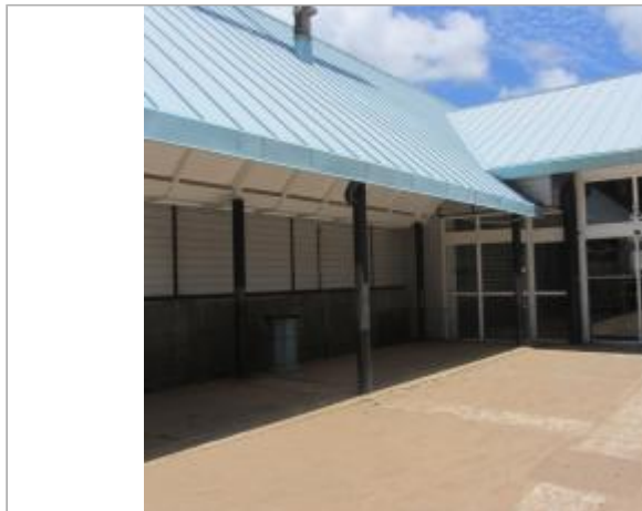
Entrée magasin consommation Bas du Fort

Coordonnées WGS84 : X: -61.51625700 / Y: 16.21837600