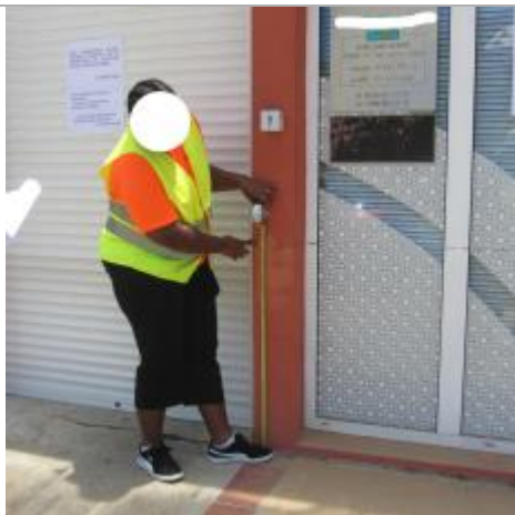
Dépôt de matières solides

Altitude calculée de l'eau (en m) : 2.867 m