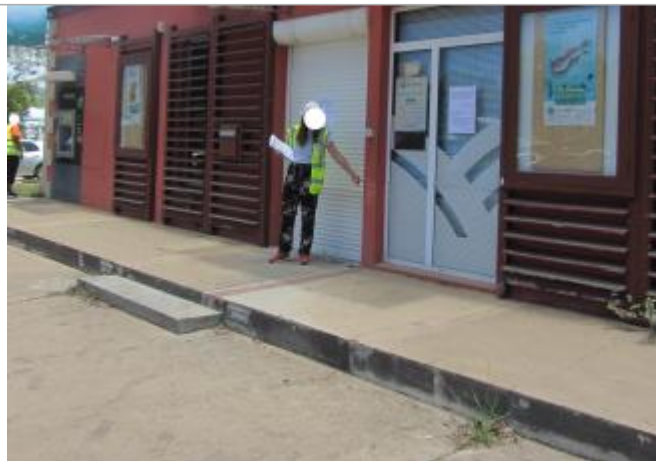
Façade enseigne Bas du Fort

Coordonnées WGS84 : X: -61.51555500 / Y: 16.21831400