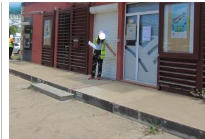
Façade enseigne Bas du Fort